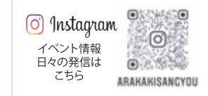
Instagram イベント情報 日々の発信は こちら ARAHAKISANCYOU

実際に人が住まれる お宅を見ることも 家づくりの準備には 欠かせないポイントです!