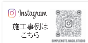
Instagram 施工事例は こちら SIMPLENOTE.ARAKI.STUDIO