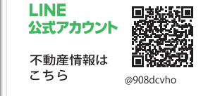
LINE 公式アカウント 不動産情報は こちら @908dcvho